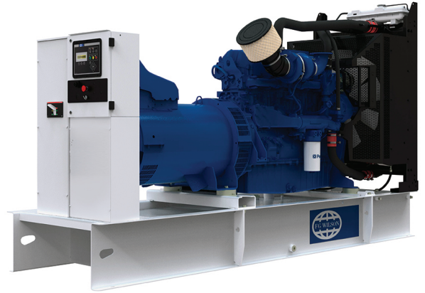
Imagen con finalidad ilustrativa únicamente