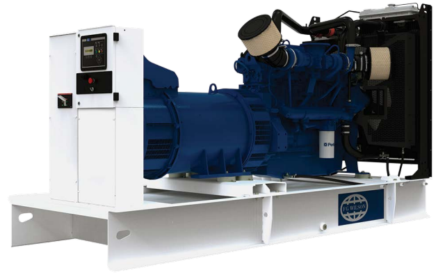
Imagen con finalidad ilustrativa únicamente