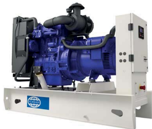
Imagen con finalidad ilustrativa únicamente